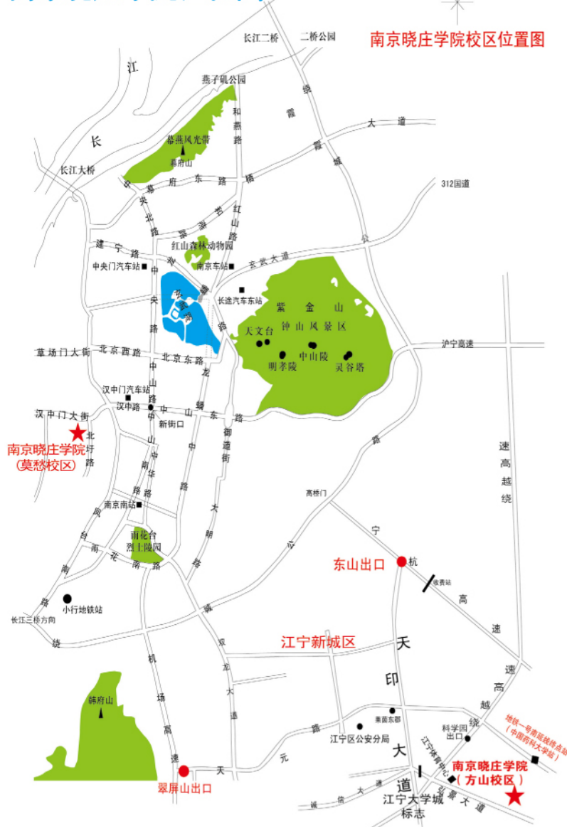
南京晓庄学院校区位置图